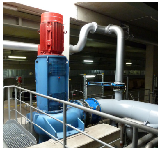
Altausrüstung vor der Demontage