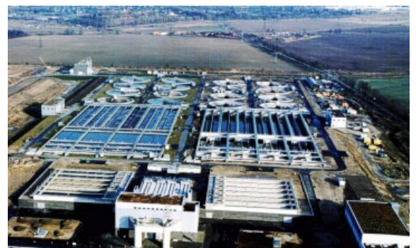
Klärwerk Waßmannsdorf (OT Berlin-Schönefeld)